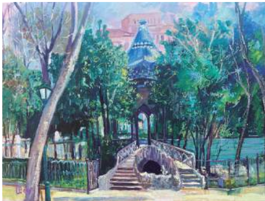
Templete de los Jardinillos 73 x 54 cm. Oleo sobre lienzo