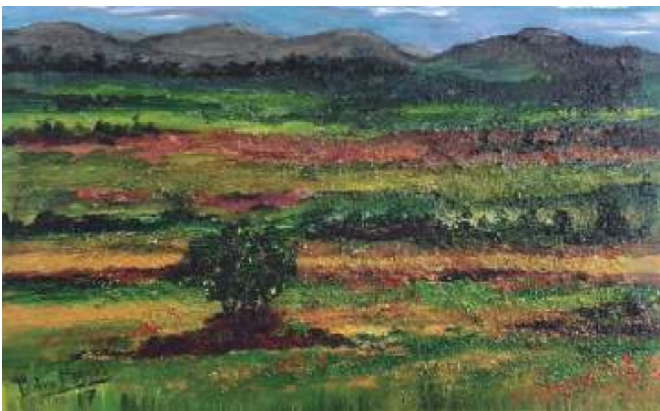
Paisaje 28 X 20 cm. Acrílico con texturas