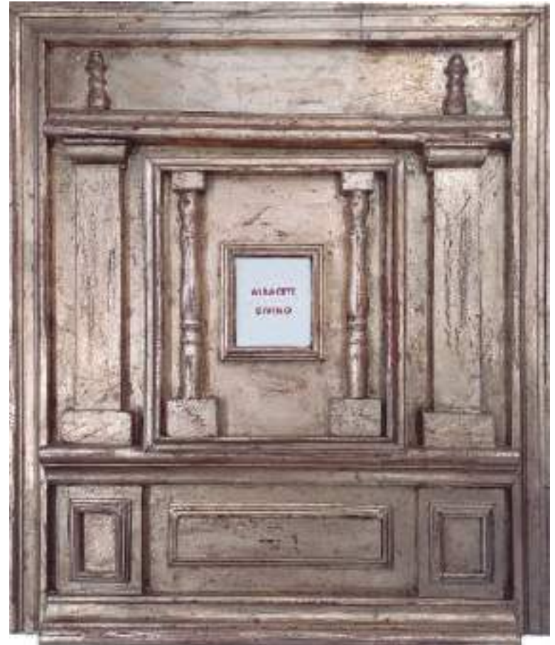
"Albacete Divino" Libro de Artista, cartón DM, madera estucada y dorada Texto e imágenes digitalizadas, manipuladas con procedimientos manuales