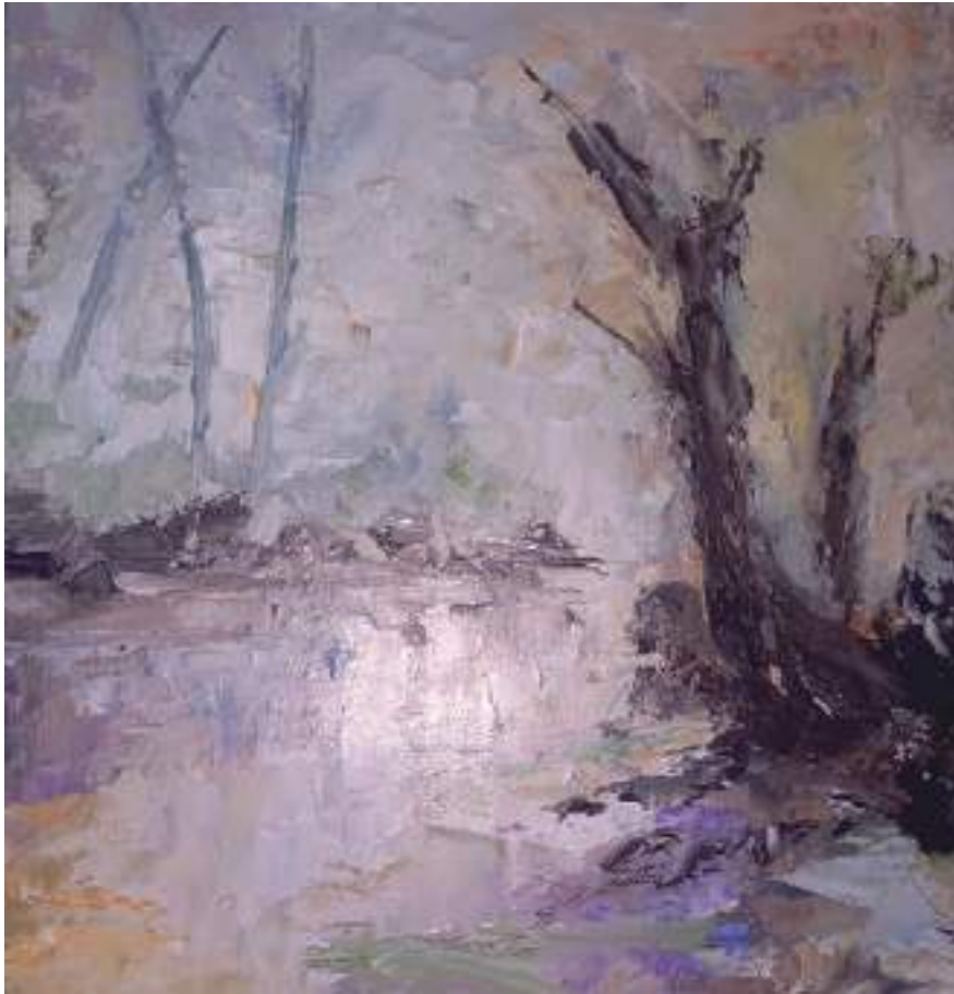
Ribera de Cubas 24 x 19 cm. óleo sobre cartón DM