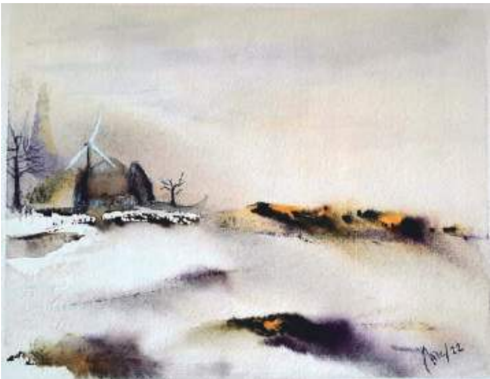
El Molino Boriles. Nava de Arriba, Albacete. 24 x 19 cm. Acuarela en Arches de 300 g.