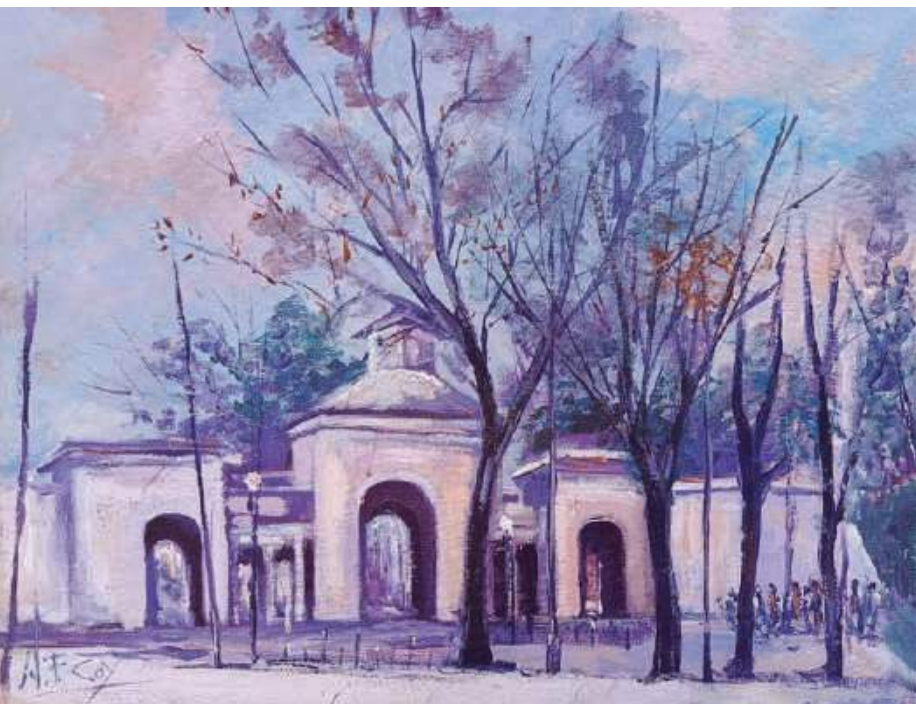
Puerta de hierro recinto ferial 46 x 38/ cm. Oleo sobre lienzo