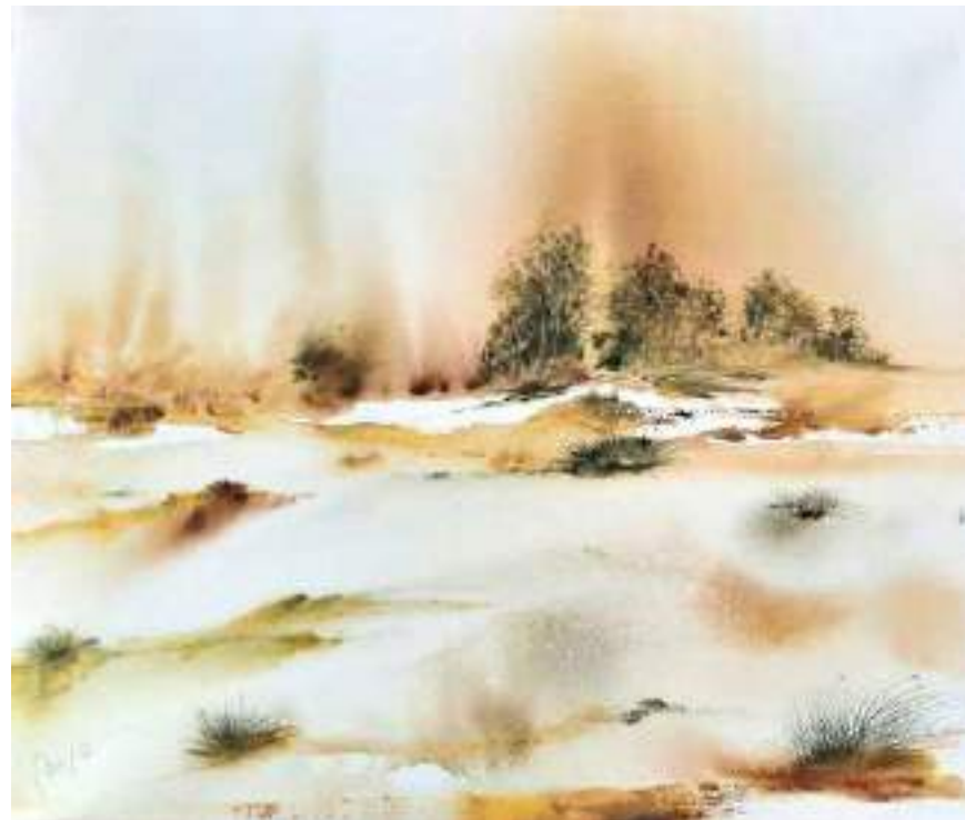
Laguna del Acequi6n. Albacete. 60 x 50 cm. Acuarela en Arches de 300 g.