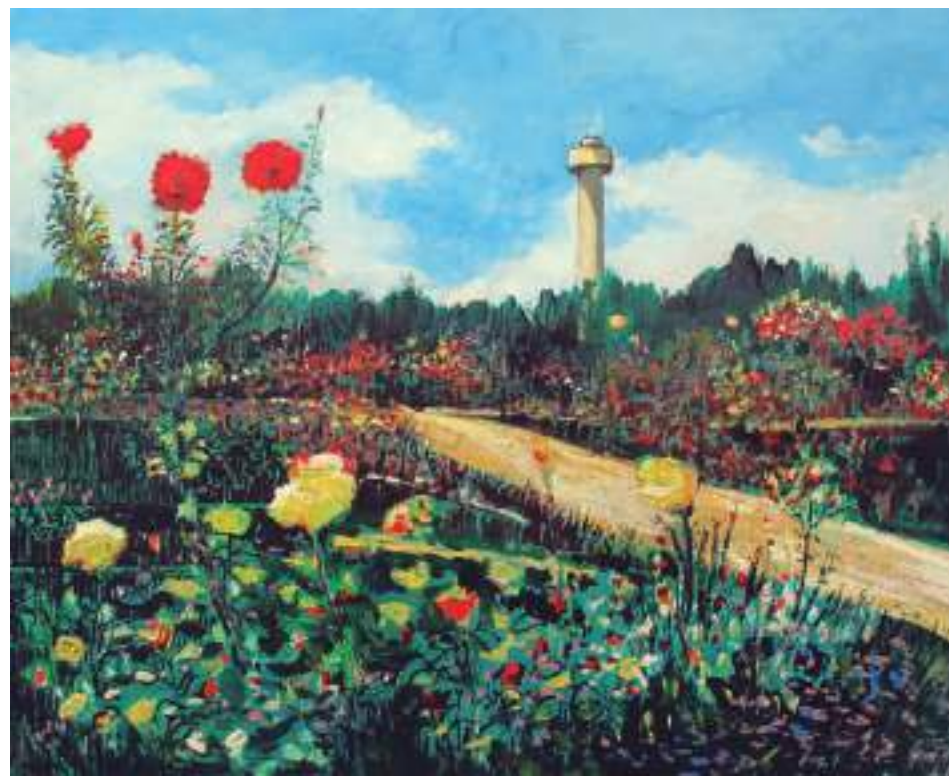
Rosaleda de La Fiesta del Arbol Acrílico sobre tabla 50 x 60 cm.