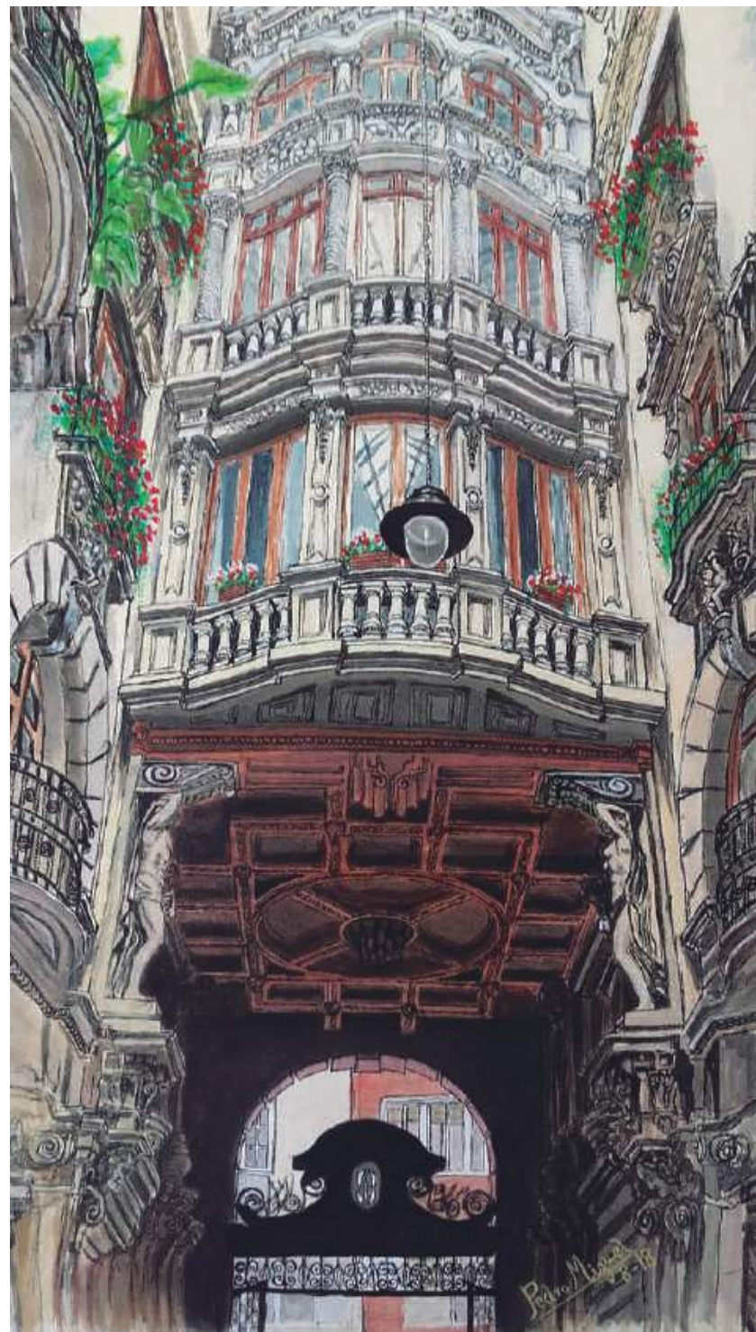
Pasaje Lodares 60 X 50 cm. Técnica Acuarela