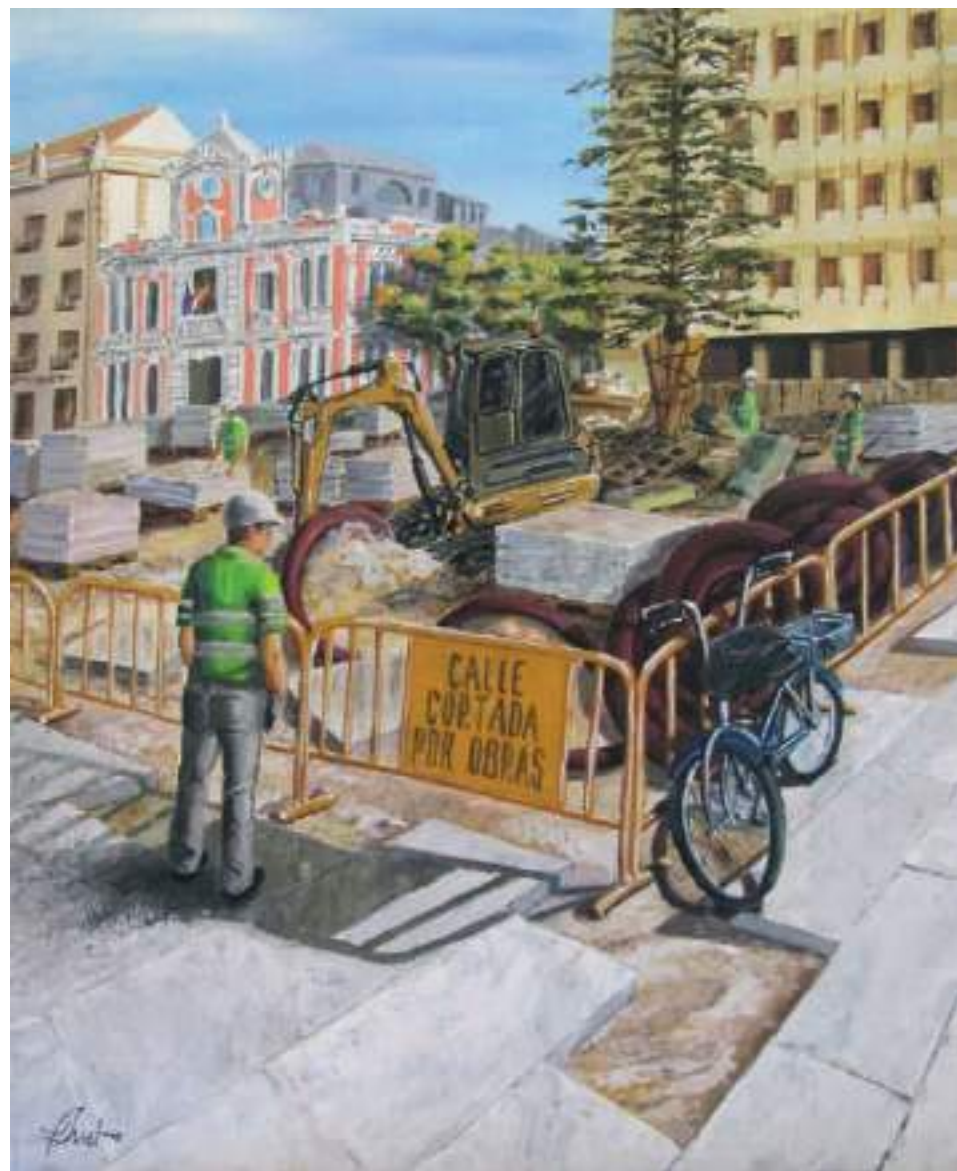
Albacete 2027 Acrílico sobre bastidor de madera 61 x 49,5 cm.